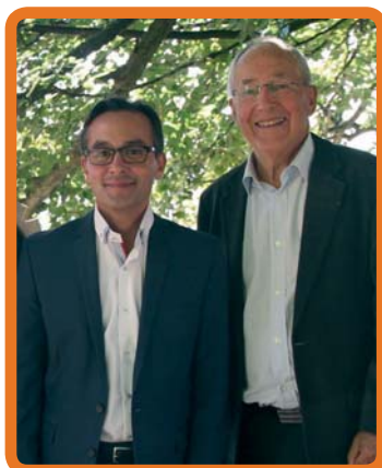
Avec Claude Gaillard, ancien député de la circonscription